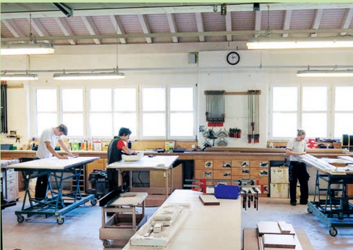
Ein Lehrbetrieb hat automatisch gute Mitarbeiter: Werkstatt von Keller Züberwangen.