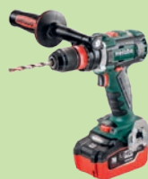
2. PREIS: Akku-Bohrschrauber «BS 18 LTX BL Q I 2x LiHD 5.5Ah» im Wert von 749 Franken.