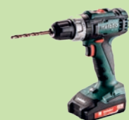
4. PREIS: Akku-Bohrschrauber «BS 18 L 2x 2,0Ah» im Wert von 259 Franken.