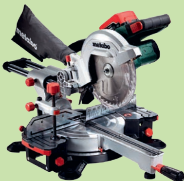
1. PREIS: Akku-Kappsäge «KGS 18 LTX 216 2 x LiHd 5.5 Ah» im Wert von 999 Franken.