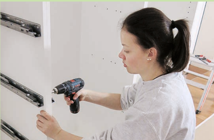
In grösseren Betrieben bekommen die Lernenden womöglich mehr Abwechslung.