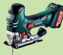
3. PREIS: Akku-Stichsäge «STA 18 LTX 14,0 2x4,0 Ah-MC10» im Wert von 549 Franken.