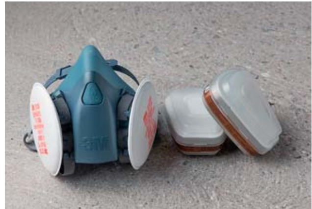
Bild 23 Eine Halbmaske mit Partikelfiltern ist mehrmals verwendbar. Mit Aktivkohlefiltern (rechts) schutzt sie auch gegen Losemitteldampfe.