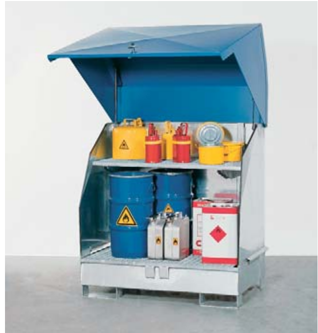
Bild 27 Abschlissbares Gefahrstoffdepot

Gehen Sie sorgfältig mit Gebinden um, die noch Reste von Chemikalien enthalten. Bedenken Sie, dass die Lagervorschriften für Lösemittel auch für lösemittelhaltige Abfälle gelten.