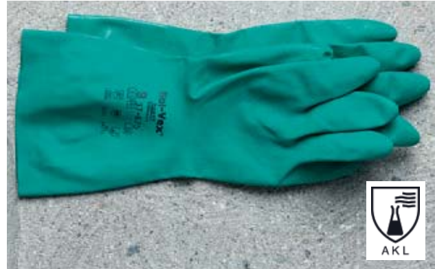
Bild 20 Handschuhe zum Schutz vor Chemikalien. Informieren Sie sich über die Schutzwirkung Ihrer Handschuhe.

Normale Handcreme und Pflegecreme bieten keinen Schutz vor Chemikalien, unterstützen aber nach der Arbeit die Hautregeneration 6 .