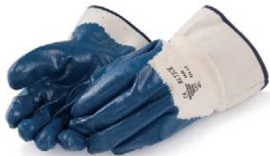
Bild 16 Beschichtete Handschuhe sind für das Arbeiten mit Zement eine gute Wahl.