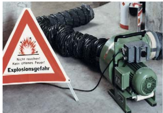
Bild 18 Verwenden Sie einen Ex-geschützten Ventilator. Saugen Sie immer ab – das ist viel effizienter als das Hineinblasen frischer Luft.

Publikationen Nr. 1825 «Brennbare Flüssigkeiten» und Nr. 2153 «Explosionsschutz»