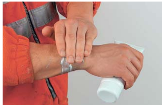
Bild 22 Vor der Arbeit aufgetragen, wirkt eine Hautschutzcreme als Basisschutz gegen Chemikalien.