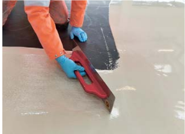
Bild 7 Einweghandschuhe bieten nur einen beschränkten Schutz und sind nur zulässig, wenn sie konsequent nach jedem Kontakt mit Kunstharzen gewechselt werden.

Direkter Hautkontakt mit Kunstharzen ist auch möglich, wenn Griffe, Gebinde und dergleichen verschmutzt sind. Lassen Sie solche Verschmutzungen