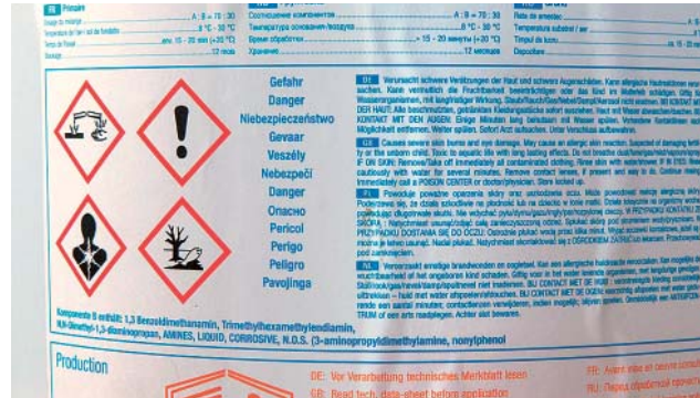
Bild 9 Hinweis «Enthält Epoxide». Die wichtigsten Informationen sind manchmal schwierig zu finden.