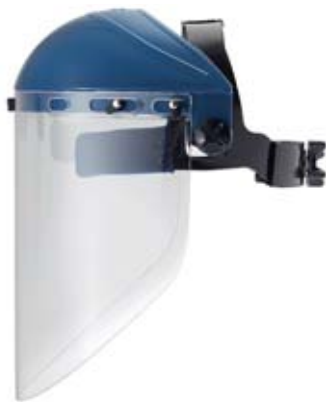
Bild 13 Ein Gesichtsschutzschild schützt Augen und Gesicht beim Arbeiten mit gefährlichen Flüssigkeiten.