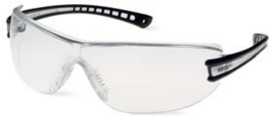
Bild 24 Eine leichte Schutzbrille reicht aus, wenn nur mit einzelnen Spritzern zu rechnen ist.