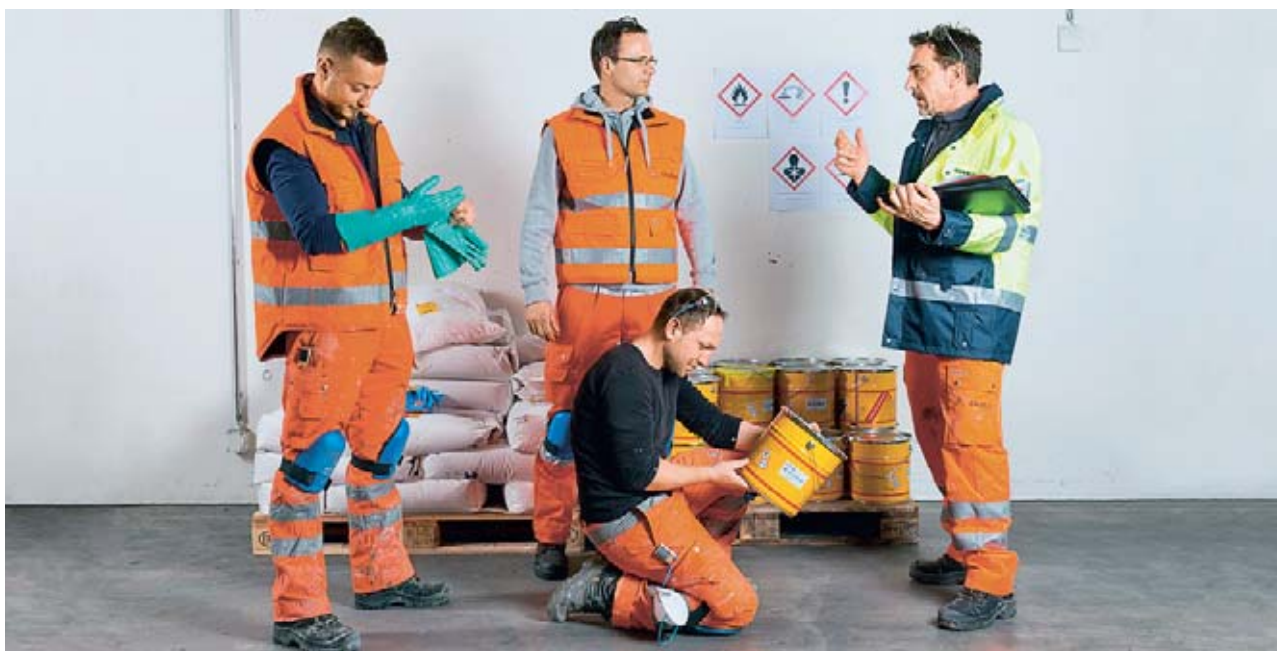
Bild 5 Vermitteln Sie Ihren Mitarbeitenden Gefahren und Schutzmassnahmen gleich vor Ort.