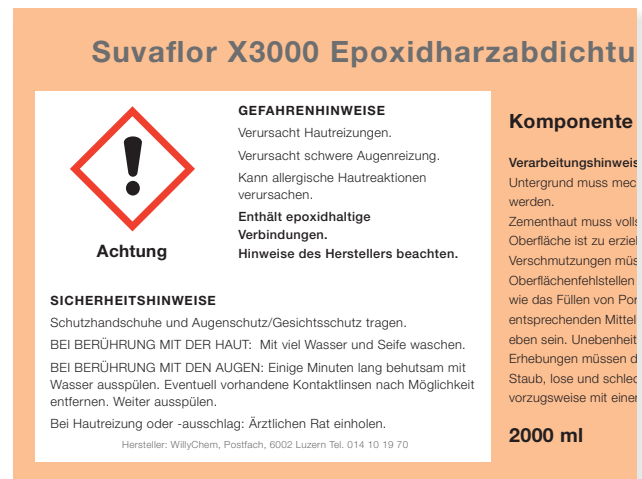
Bild 1 Die Kennzeichnungsetikette orientiert über die Gefahren und wichtigsten Schutzmassnahmen.

Auch auf selbst abgefüllten Gebinden muss in sinnvoller Weise auf die gefährlichen Eigenschaften des Produkts hingewiesen werden.