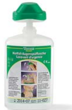
Bild 14 Eine kleine Augenspülflasche (ab 2 dl) hat überall Platz.