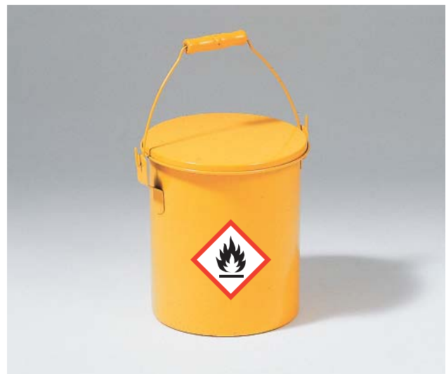
Bild 17 Geschlossener und gekennzeichneteter Behälter, in dem Teile mit Lösemitteln gereinigt werden.

Vermeiden Sie wiederholten Kontakt mit der Haut. Etwa indem Sie Hilfsmittel verwenden oder Chemikalienschutzhandschuhe tragen. Einweghandschuhe bieten nur einen beschränkten Schutz. Lassen Sie nicht zu, dass Hände mit Lösemitteln gereinigt werden.