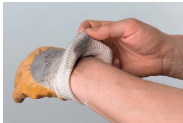
Bild 21 Arbeiten in verschmutzten Handschuhen ist schädlich, weil dadurch über längere Zeit Chemikalien an die Haut abgegeben werden.