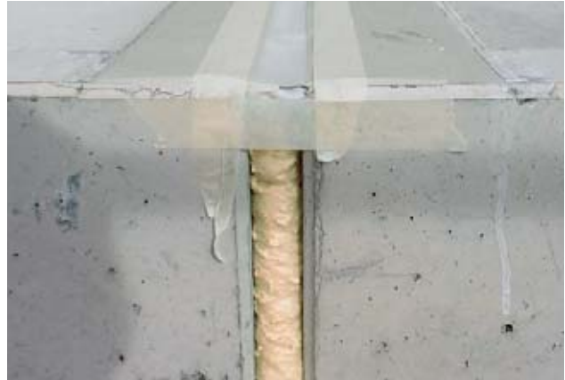
Bild 11 Polyurethane stecken in vielen Produkten, nicht nur in Montageschäumen.