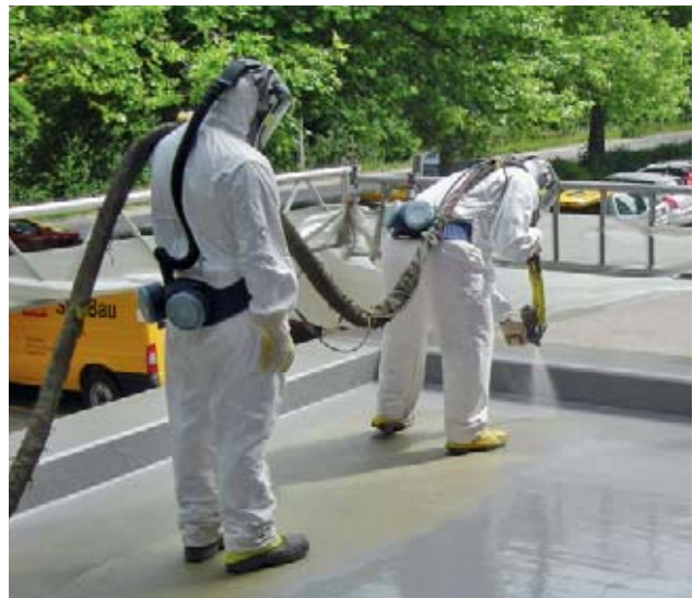
Bild 12 Wer Polyurethane versprüht, muss strenge Schutzmassnahmen treffen. Auch für die Kollegen in der Nähe.