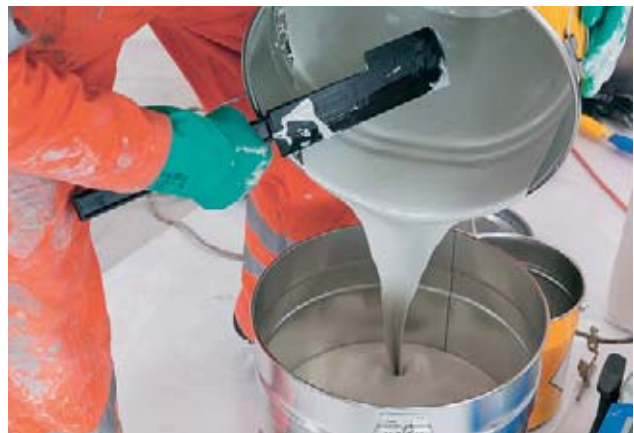
Bild 8 Beim Mischen, Reinigen und Umfüllen sind richtige Chemikalienhandschuhe unerlässlich.

sofort entfernen, am besten mit Putzlappen, die nur einmal verwendet werden. Sonst werden die Harze über den ganzen Arbeitsbereich verschleppt.