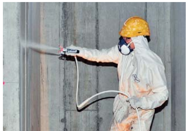
Bild 19 Beim Spritzen von lösemittelhaltigen Produkten sind immer Explosionsschutzmassnahmen zu treffen, und es ist immer eine Atemschutzmaske oder ein Atemschutzsystem zu tragen.