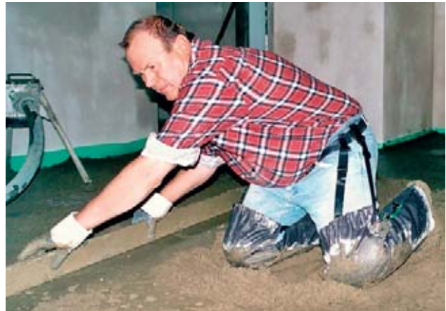
Bild 15 Mit «Abziehhosen» oder wasserdichten Knieregionen werden Verätzungen durch Zement verhindert.

Weitere Informationen: Suva-Checkliste Nr. 67030 «Zementekzem»