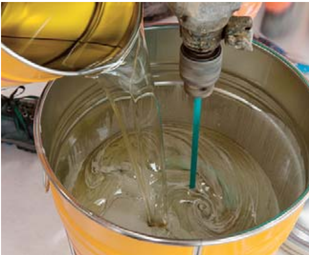
Bild 6 Die Kunstharz-Komponenten reagieren miteinander. Dies birgt Gefahren für die Gesundheit.

Gemeinsam ist ihnen, dass meistens zwei pastenartige oder flüssige Komponenten miteinander reagieren und zu einem festen Material werden. Die Reaktionsfähigkeit der Komponenten kann bei Hautkontakt oder beim Einatmen der Dämpfe zu Gesundheitsproblemen führen.