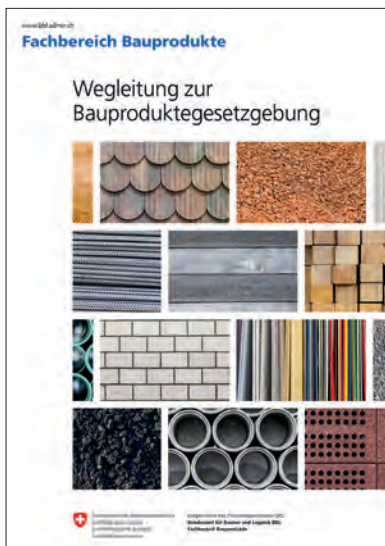
BLL – Wegleitung zur Bauproduktgesetzgebung [12]

Die Produktinformationsstellen der Lignum und der Verbände geben Auskunft zum Bauproduktgesetz und über anwendbare technische Normen. Die Produktinformationsstelle der Lignum ist von Montag bis Freitag von 08.00 Uhr bis 12.00 Uhr über folgende Nummer erreichbar: Tel. 044 267 47 83 [17].